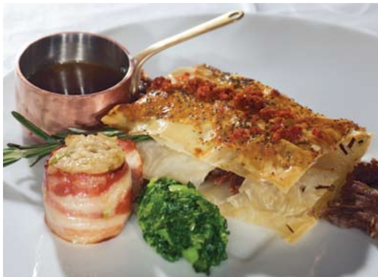
Folhado de pato

são tubinhos de massa muito bem frita, seca e estaladiça, recheadas de um creme de ovos, e cobertas com canela e açúcar. O pudim de abade de Priscos pareceu-me uma versão aligeirada, mas muito equilibrada. O folhado de maçã poderia beneficiar de uma maçã mais ácida, reineta ou granny smith, mas os cubos assados sob um quadradinho de massa folhada e rodeados de um especiado e complexo molho fazem um final sedutor e longo. O fondant de chocolate veio frio e num caso cozinhado demais, mas largamente compensado pelo fragrante molho de açafraão. O semi-frio de alfarroba estava delicado, complexo, com aromático gelado de noz-moscada