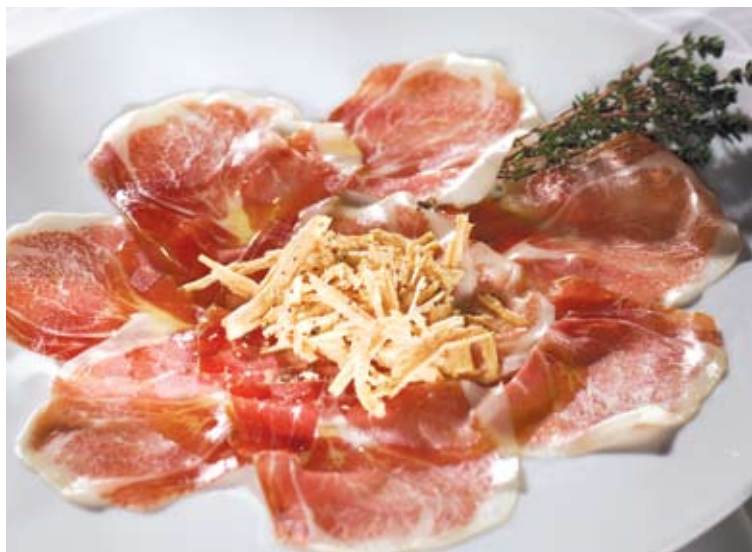
Carpaccio de presunto com foie gras