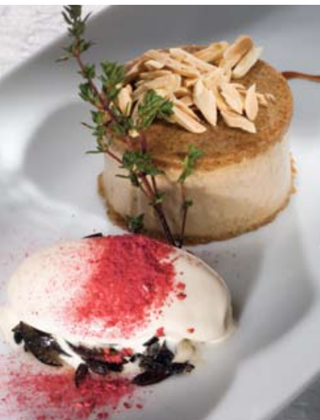
Semi-frio de alfarroba com gelado de noz-moscada e azeitonas confitadas

to cuida dos pormenores. A lista de vinhos foi concebida por Jorge Bitá, que já não está na casa, e é agora gerida pelo chefe de sala Paulo Silva. No Quarenta e 4 está-se bem, come-se bem, bebe-se bem. É o tipo de restaurante onde o espaço se impõe, acolhedor e aconchegante, e a comida de base portuguesa nortenha se apresenta variada, fundada em boas raízes, aligeirada, mas sem lhe modificar o cariz. As influências externas aqui não substituem a origem portuguesa, antes a temperam, a inspiram, a tornam um pouco mais leve. É ainda um restaurante amigo do vinho, onde se leva uma garrafa sem levantar perguntas, se partilha com o pessoal interessado, ou mesmo com a mesa do lado. Brilham alto as sobremesas e o ambiente. O serviço é simpático e afável, mas pede algum apuramento. Precisam de afinação (ou de mais presença do chefe?) alguns pormenores de cozinha que, quando forem vencidos, podem transportar este 40 e 4 definitivamente para um outro patamar. É já um restaurante a visitar e revisitar. A defender, que tantas baixas temos tido estes dias. ○